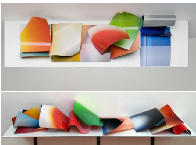
Display (polyptyques sur étagères (10 feuilles chacun)), 2009 Aluminium peint, laque, vernis.

Vue d'installation, Musée des Beaux-Arts, Dole, France, 2015