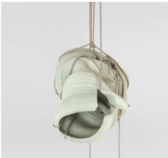
Shibari (installation), 2015 Corde, céramique, argile

Vue d'exposition, Tracy Williams gallery, New York, États-Unis, 2016