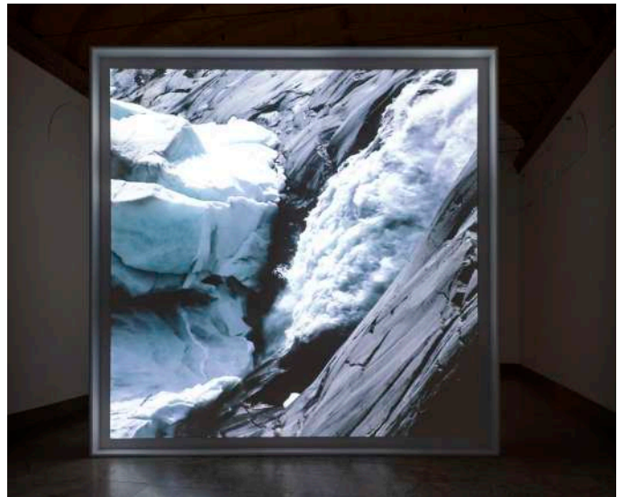
2. Vue d'exposition, La Formule du Temps, Centre international d'art et du paysage de Vassivière, Vassivière, France, 2020

1. 7306 jours avec Liberté (Installation), 2021 35 sculptures de cire, dimensions variables.