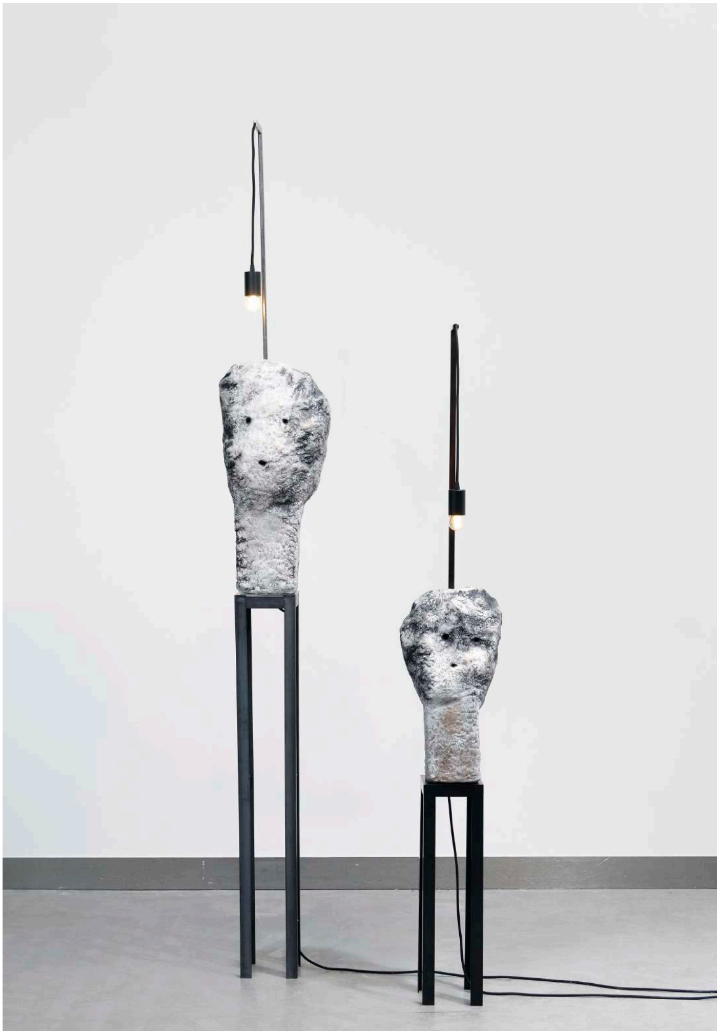
Vue d'installation, French Design, Paris, France, 2022