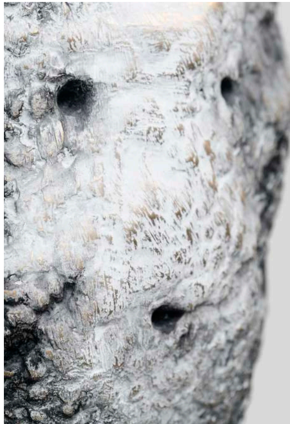
Vue d'installation, French Design, Paris, France, 2022, © Aurélien Mole