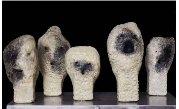
Vue d'exposition, Qui es-tu ?, Centrum Gietdowe, Varsovie, Pologne, 2022