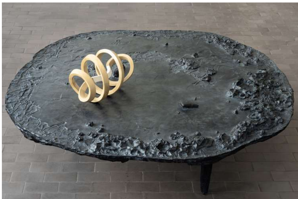
Vue d'installation, LABÒ, Milan, Italie, 2023