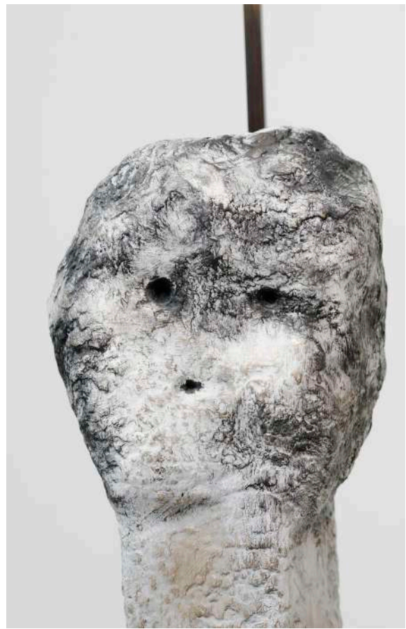
Vue d'installation, French Design, Paris, France, 2022, © Aurélien Mole