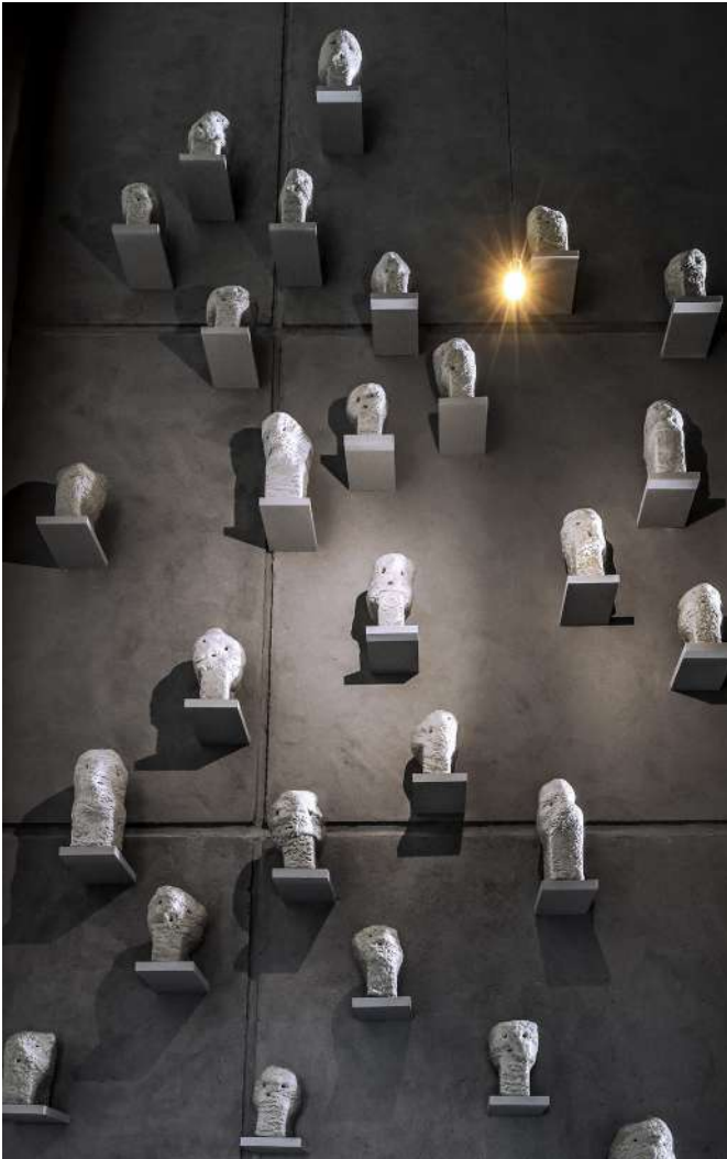
1. Vue d'exposition, La Galerie Kewenig, Berlin, Allemagne, 2022