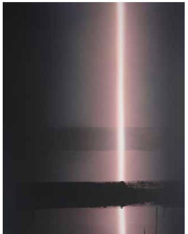
Put back, Dan 2 (peinture), 2023 Acrylique sur toile, 80 x 100 cm