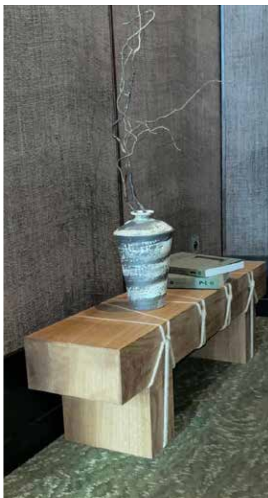
Vue d'installation, Hôtel Hana, Paris, France, 2024