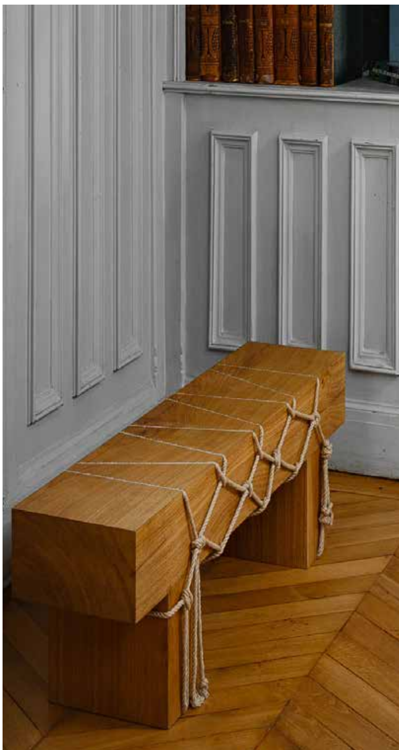
Vue d'installation, Private Choice, Paris, France, 2023