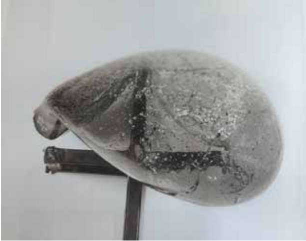
Vue d'installation, Richard Taittinger Gallery, New York, États-Unis, 2024