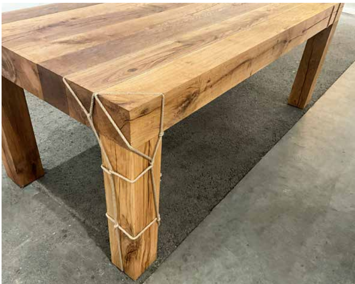
Vue d'installation, Art Paris, Paris, France, 2024