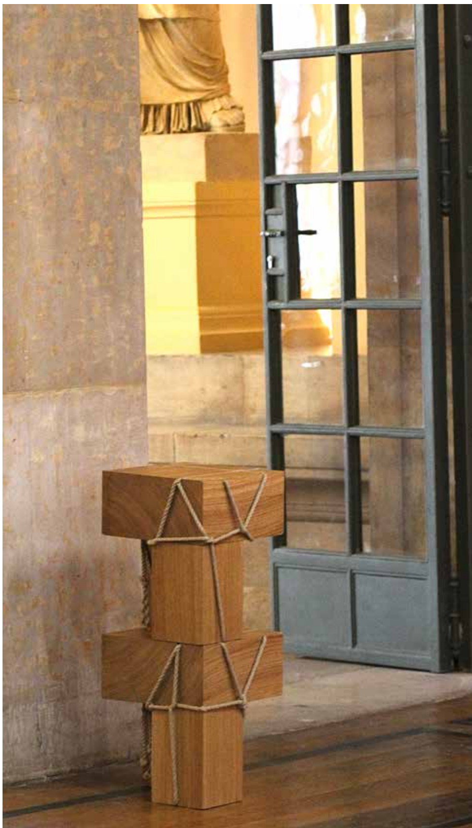
Vue d'installation, Beaux-Arts de Paris, Paris, France, 2023, © Alice Randazzo