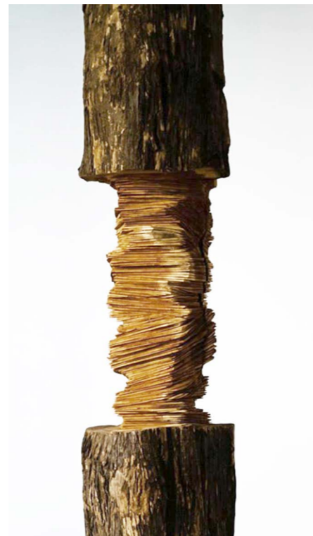
Détails de l'installation