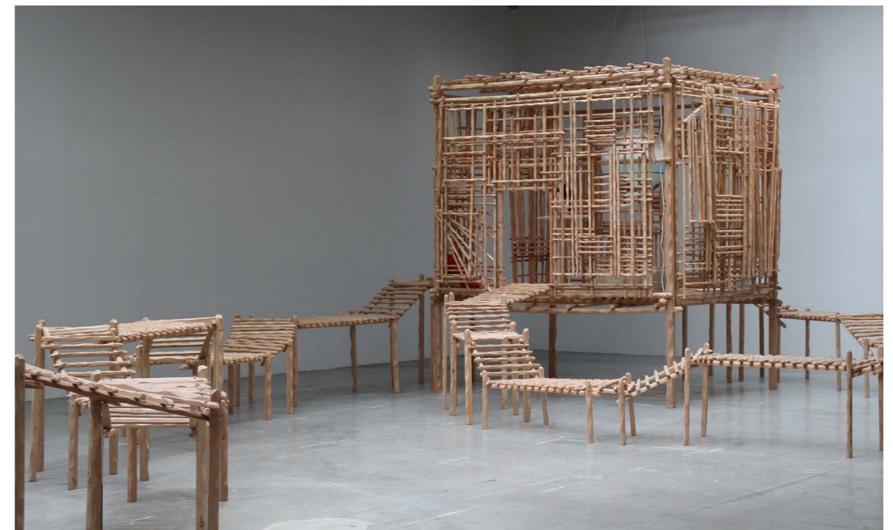
Vue d'exposition, Palais de Tokyo, Paris, France, 2016