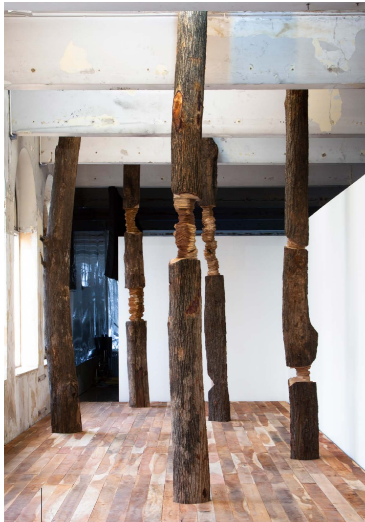
Vue d'installation, Beyond Bliss, Biennale de Bangkok, 2018