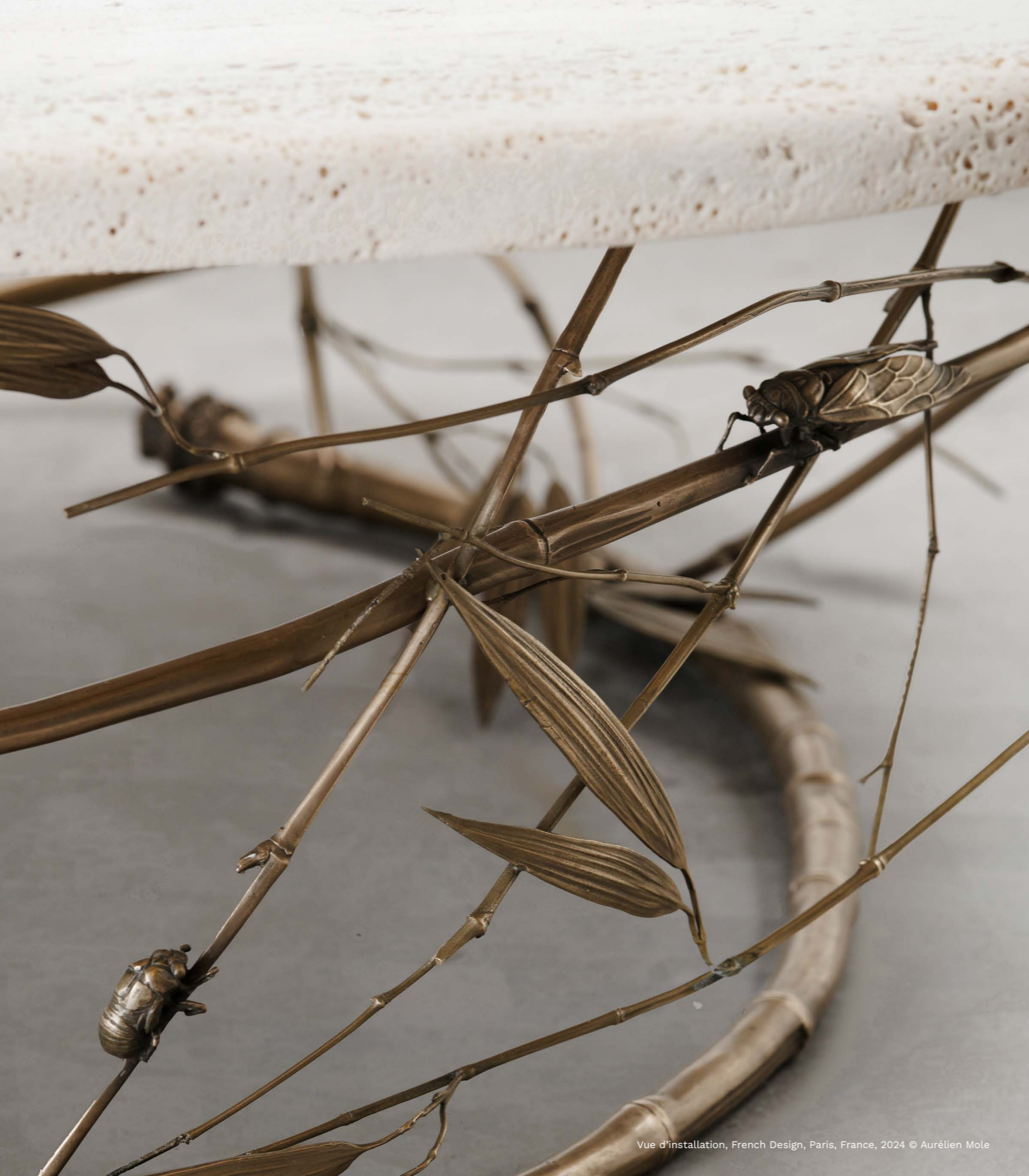
Vue d'installation, French Design, Paris, France, 2024