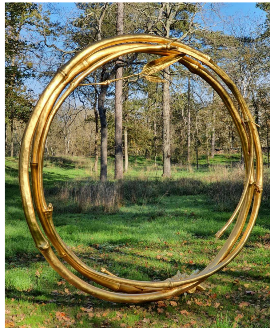
Vue d'installation permanente, Château de la Haute Borde, Rilly-sur-Loire, France, 2020