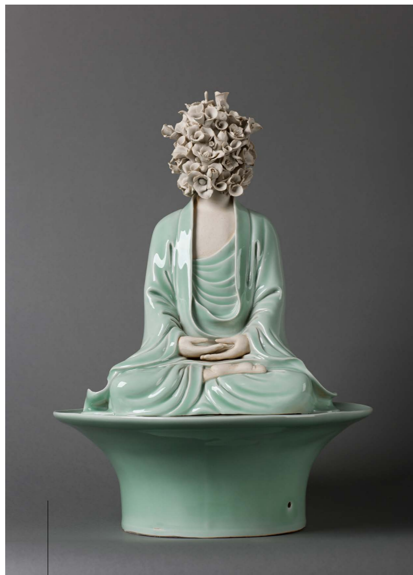
1. Zen meditation , 2014 Biscuit, céramique. 45 x 30 x 30 cm