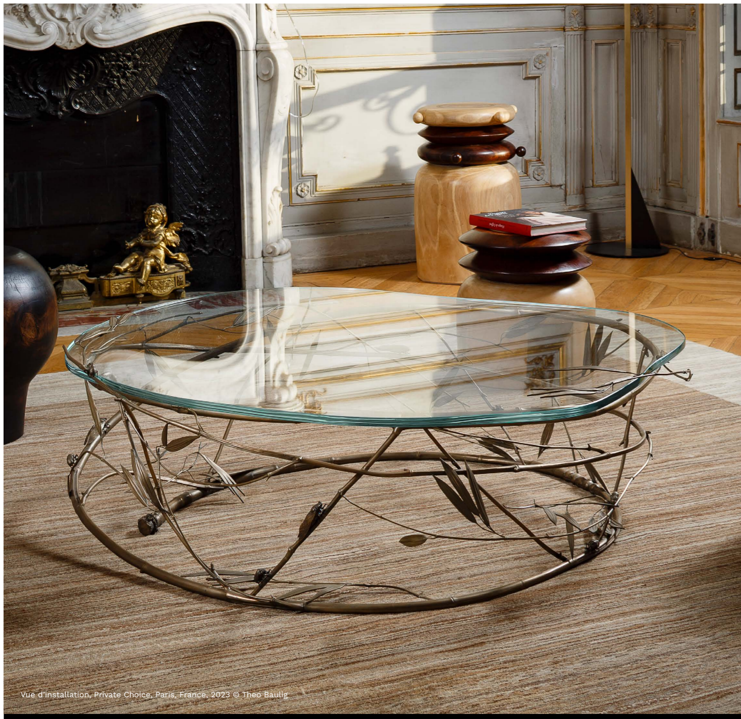
Vue d'installation, Private Choice, Paris, France, 2023