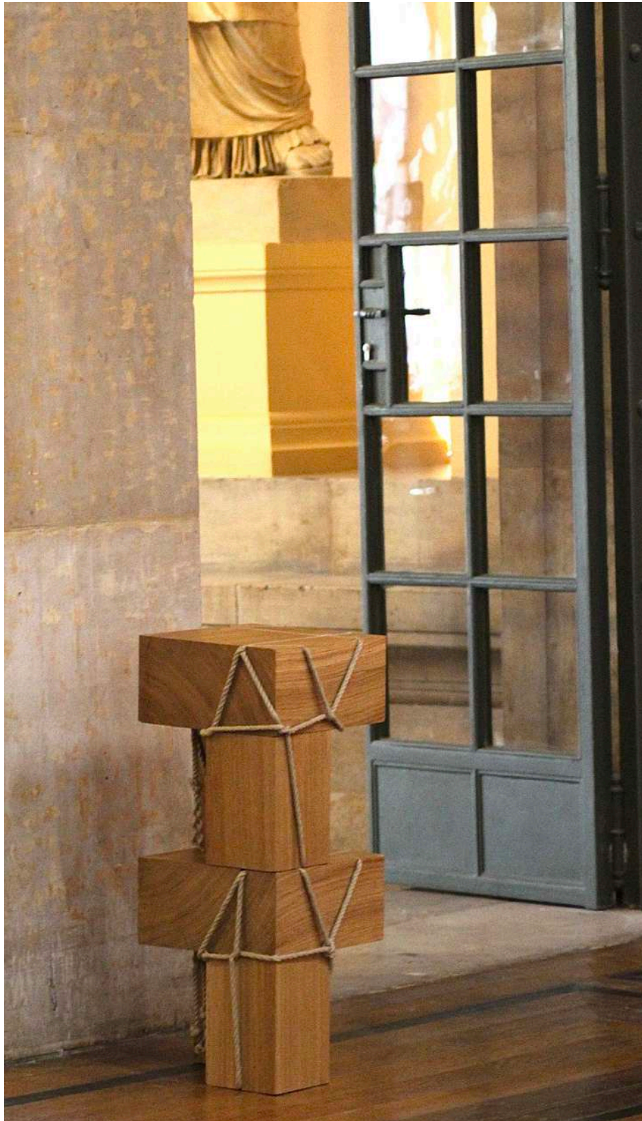
Vue d'installation, Beaux-Arts de Paris, Paris, France, 2023, © Alice Randazzo