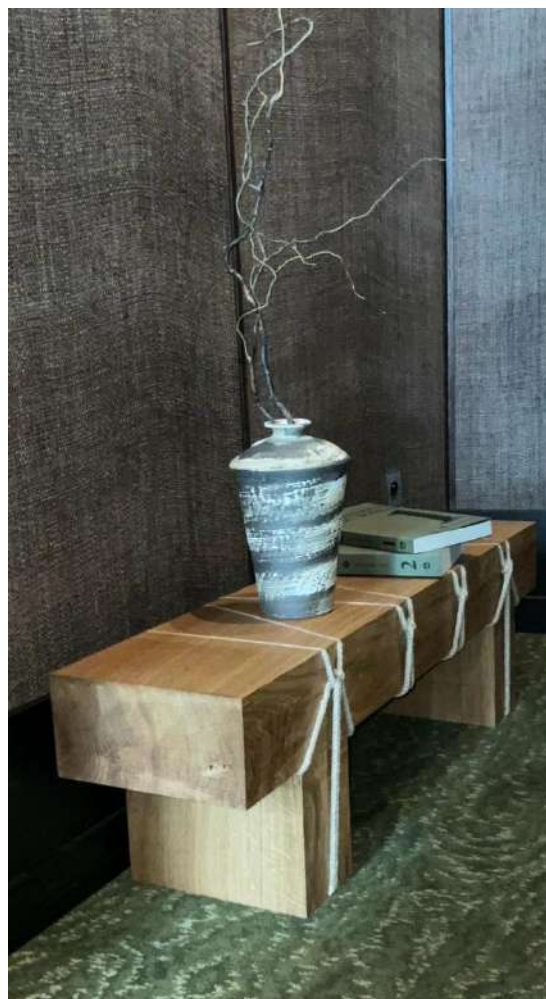
Vue d'installation, Hôtel Hana, Paris, France, 2024