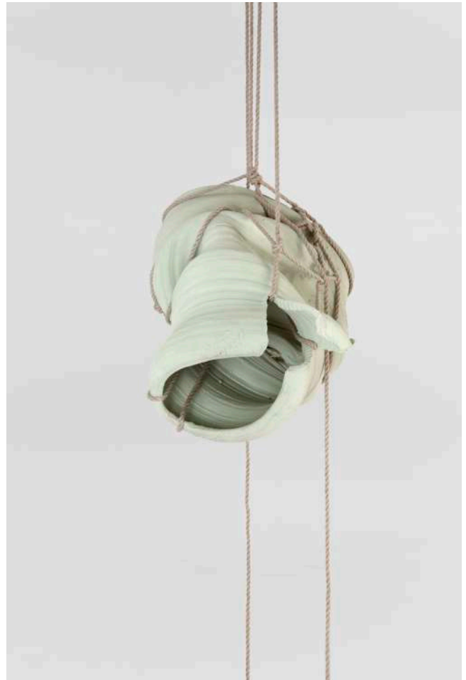
2. Vue d'installation, Musée des Beaux-Arts, Dole, France, 2015