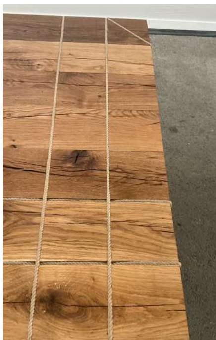
Vue d'installation, Art Paris, Paris, France, 2024