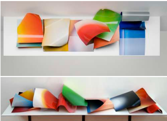
3. Vue d'installation, Galerie Loevenbruck, Paris, France, 2009

1. Dust devil (installation), 2016 Béton, fer, verre, poussière.