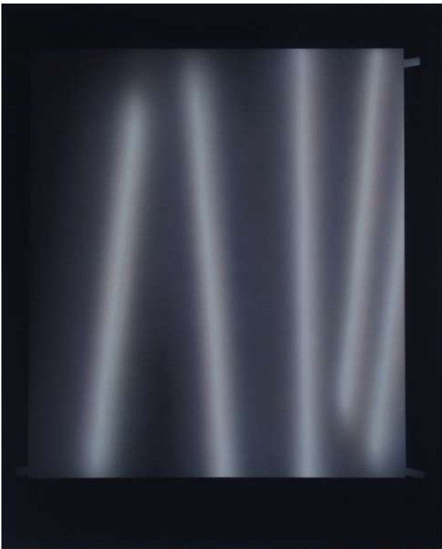
Put back, Dan 2 (peinture), 2023 Acrylique sur toile, 80 x 100 cm