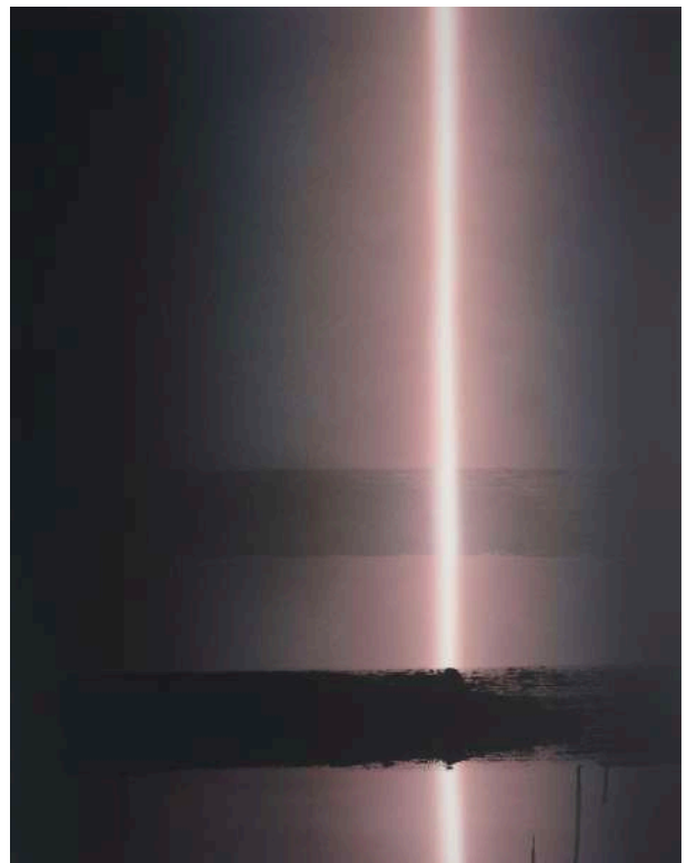
Dan évolution 7 (peinture), 2023 Acrylique sur toile, 100 x 81 cm