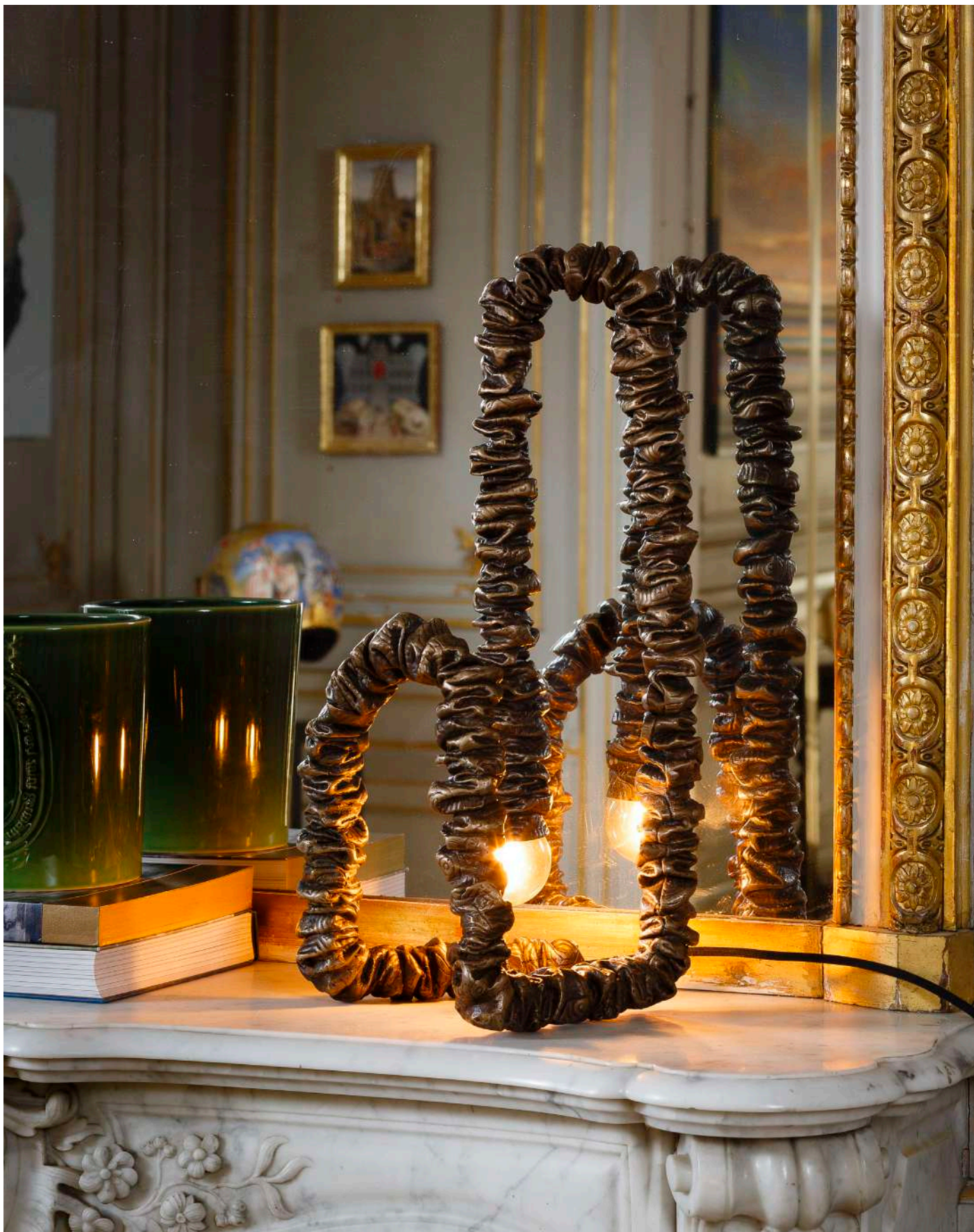
Vue d'installation, Private Choice, Paris, France, 2023, © Theo Baulig