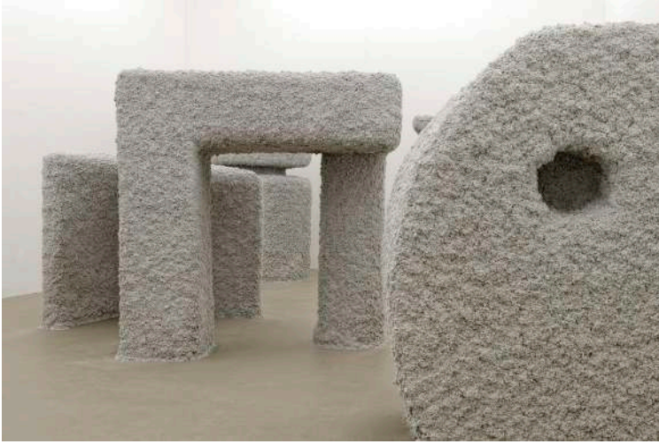
1. Vue d'exposition, Rendez vous, institut d'art contemporain de Villeurbanne, Villeurbanne, France, 2013, © Blaise Adilon