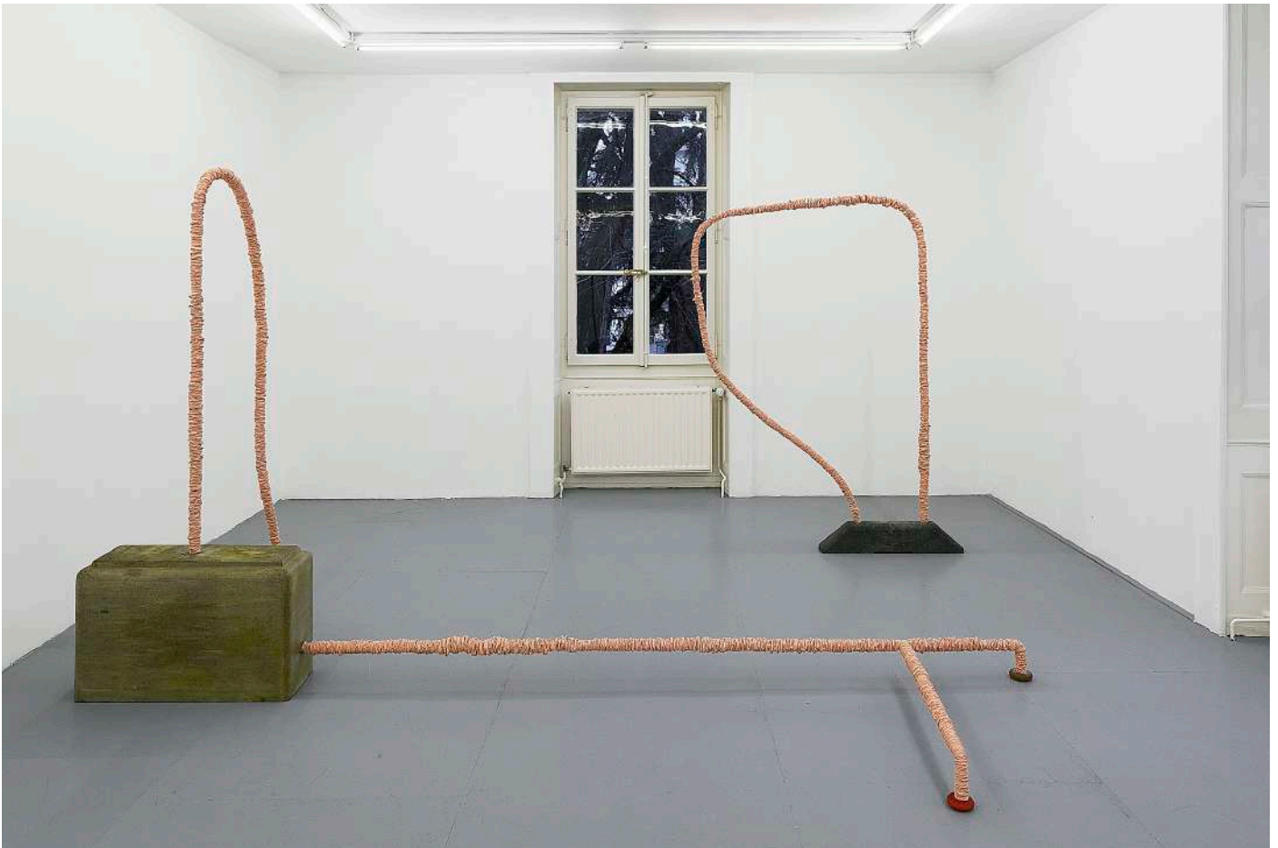
2. Vue d'exposition, Top Knot, Centre d'art la villa du parc, Annemasse, France, 2017, © Aurélien Mole.