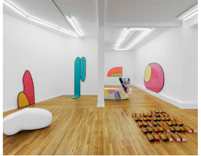
Vue d'exposition, Terre-plein, galerie Ceysson et Bénétière, Paris, France, 2021 © Aurélien Mole.