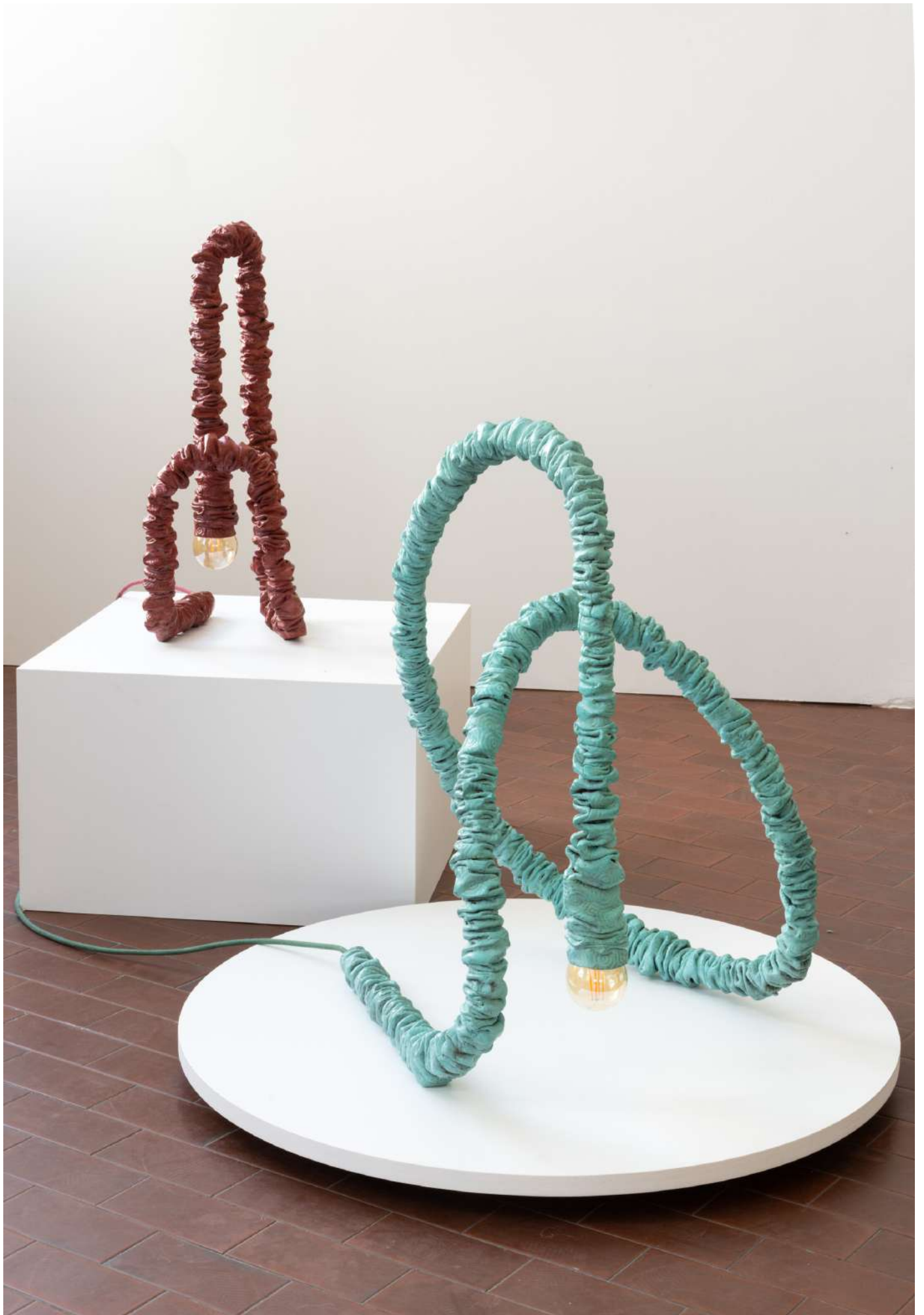
Vue d'installation, LABÒ, Milan, Italie, 2023, © Lorenzo Palmieri