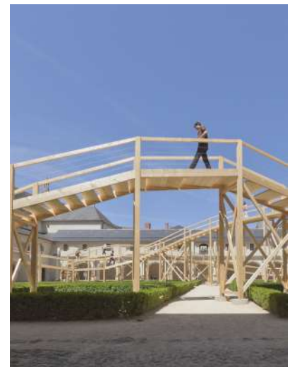
Belvedere(s) , 2012. Abbaye de Fontevraud.