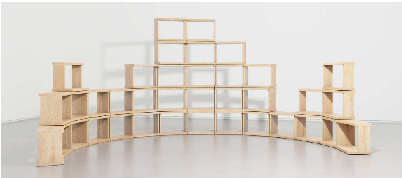
Orbis, 2023, 37 modules agencés.