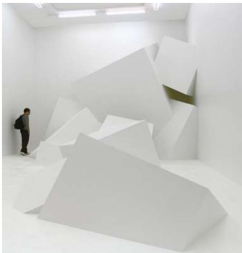
AR.07 , 2008. Institut d'Art Contemporain, Villeurbanne.