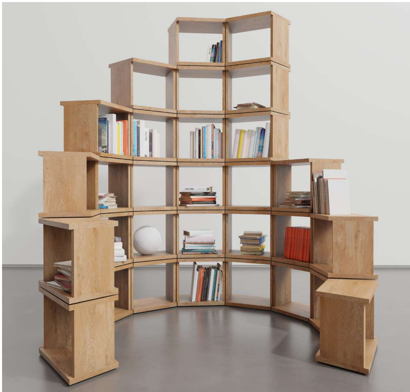
Orbis 2.1 , 2023

Orbis 2.1 , d'un diamètre de 210 cm. L'artiste propose une bibliothèque-sculpture de 6 modules minimum, auxquels peuvent s'ajouter des modules complémentaires et ce même postérieurement à son acquisition. Pour réaliser la tour complète il faut 72 modules (hauteur maximale 319 cm).