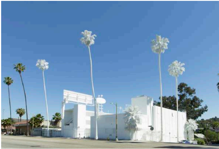
Projection ( Sunset Pacific Motel ), 2015. 4311 W Sunset Boulevard, Los Angeles.