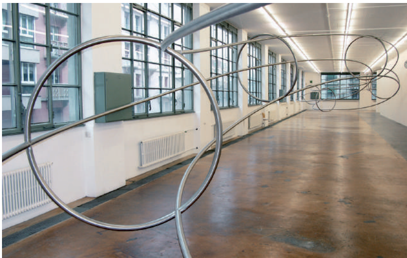
Scape , 2006. MAMCO, Genève.