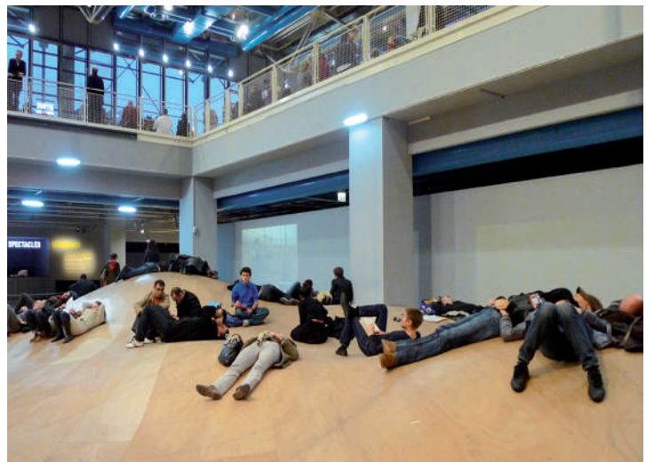
Sol.07 , 2009. Centre Georges Pompidou, Paris.