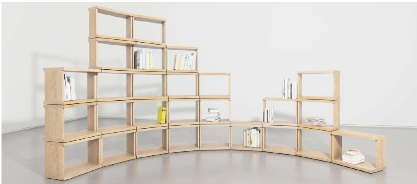
Orbis, 2023, 27 modules agencés.