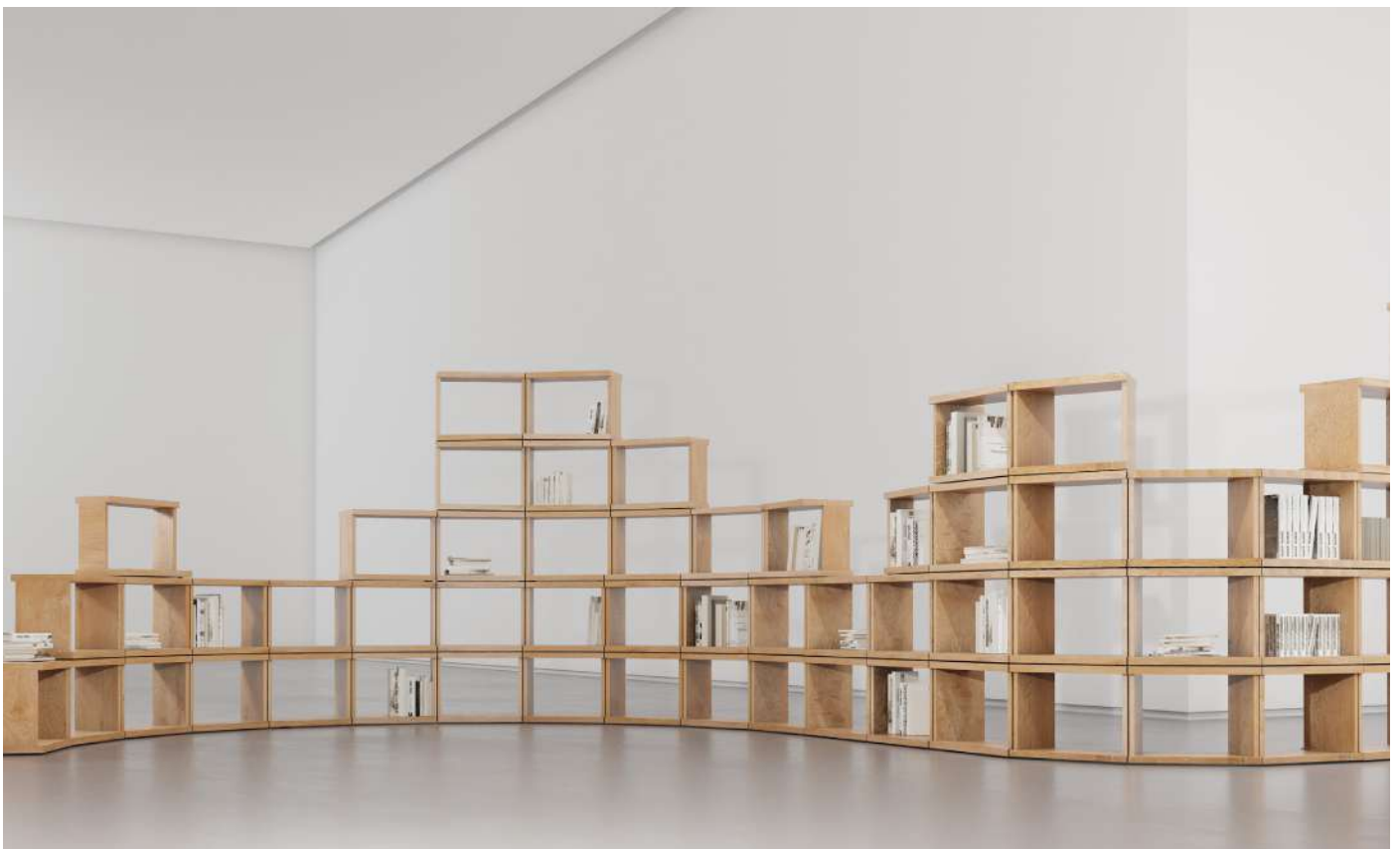
Orbis, 2023 , suggestions d'agencements.